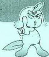
徳島県薬物乱用防止啓発キャラクター ヤクヤンくん